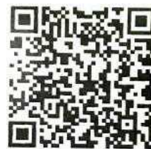
スマイルネクスト

右のQRコードから開くことが出来ます。また家庭のPCからも同じIDとパスワードで入ることが出来ます。スマイルネクストのURLは長いので、PCから入る場合には、右のQRコードを読み取ってからURLをコピーアンドペーストしていただくことをおすすめします。これらのサービスは本校独自でのもので期間も限られていますので早めにご覧いただきたいと思ひます。