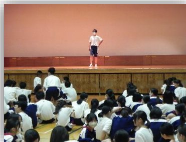
ルールを聞いて、いざ出発

7月16日(火)の4時間目に、生徒会レクが行われました。生徒会本部の企画により、『学校間違い探し』を行いました。全校生徒が体育館でレクの説明を受けている間に、生徒会役員が校舎内にいつもと違うところを10カ所設置しました。例えば、クラス表示を入れ替える、廊下に置いてあるぬいぐるみを替える、校長室で教頭先生が仕事をしているなど。チーム編成は、体育祭の団を中心に1・2・