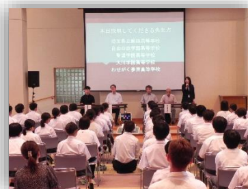
入試説明会の様子