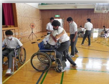
出前授業の様子(福祉)

入試説明会では、パネルディスカッション形式で県立飯能高校・自由の森学園高校・聖望学園高校・大川学園高校・わせがく夢育高校の先生方による説明が行われ、公立と私立の入試の違いや費用の違いなど丁寧に解説していただきました。また、それぞれの高校の特色ある教育活動についての紹介もあり、直接高校の先生からの話を聞くことでより一層理解を深める事ができました。入試説明会については、この様子を2年生もオンラインで視聴し、上級学校への関心を高めることができました。