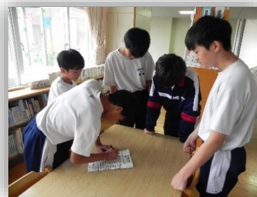
チームで相談して解答

3年の1班同士、2班同士・・・が組むようにし、学年を超えて交流が深まるよう縦割りで行いました。30分間で校舎内を巡り間違いを探しましたが、10カ所見つけるのにはひと苦勞です。でも、楽しいひとときを過ごせました。