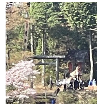
↑ 旗立ての瞬間 皆で呼吸を合わせて ↑ 旗が立ち上がりました!(ミツ山から撮影)