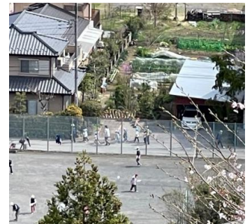
子ども達の歓声はグランドゴルフの人々も元気に

4月11日、地域に元気を振りまきながら、保育所の年中年長さんがお花見に来てくれました！