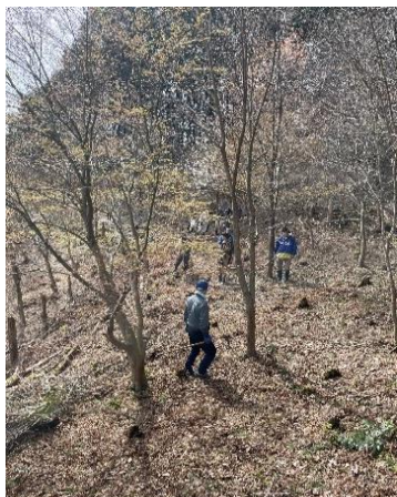
今年の蕨は,,まだ早い?