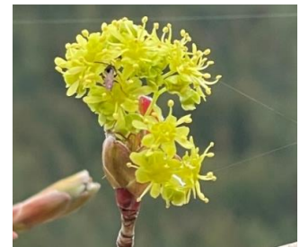
↑イタヤカエデの花(4/12)