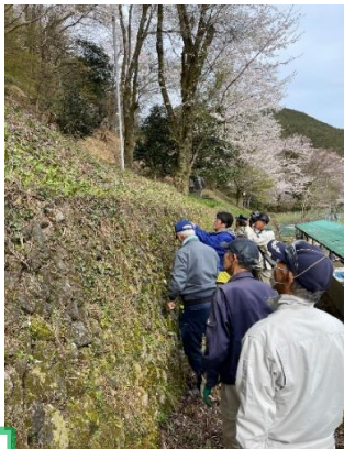
カタクリを観察する人々↑