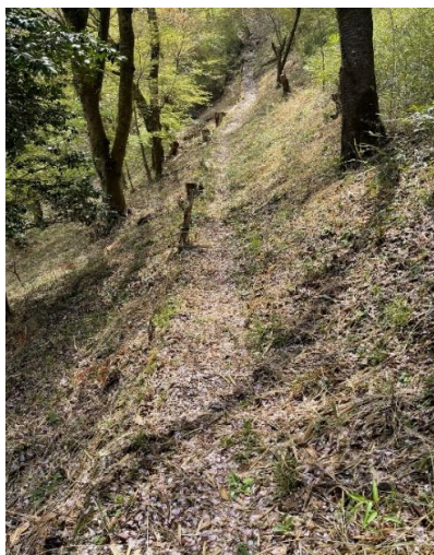
↑真平新道は花卉の道(4/11)