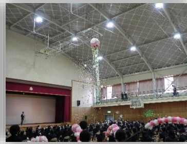
1年生の感謝の気持ちを伝える「映像」と「ステンドグラス」 くす玉で感動のフィナーレ