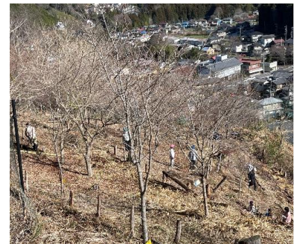
皆で力を合わせて植樹