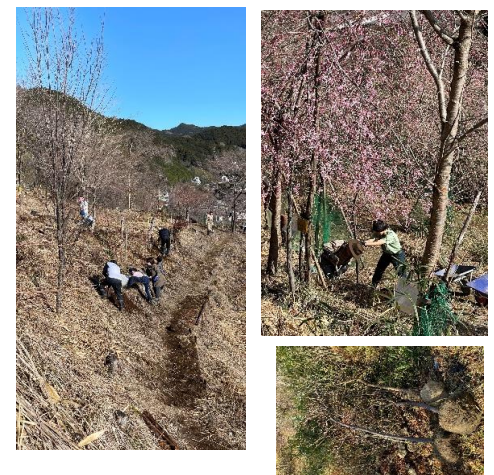
大きな苗木を 提供していただきました