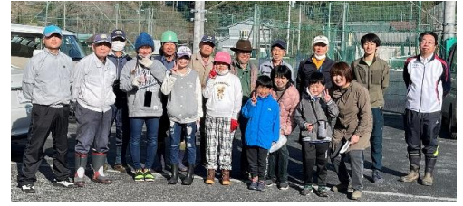
これから頑張るぞ！ 植樹会の参加者

3月19日(日)午前8時から10時まで18名(小学生と保護者3組含む)が参加して、植樹会を開催しました。原市場地区まちづくり推進委員会(花のあるまちづくり実行委員会・子ども達と原市場を元気にする事業実行委員会)との共催事業です。まちづくりから桜の苗木5本(河津桜2、陽光桜2、エドヒガン枝垂桜1)とミツバツツジ11本の提供を受けました。春の温かい陽射しの中、穴を掘ったり水を運んだり、子どもも大人も頑張りました！無事に苗木16本植樹を終えました。陽光桜がすぐにきれいな花を咲かせました！